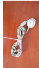
Zdjęcia do wykazu 3 #8