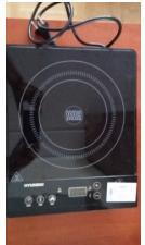
Zdjęcia do wykazu 3 #9