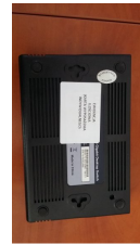
Zdjęcia do wykazu 3 #10